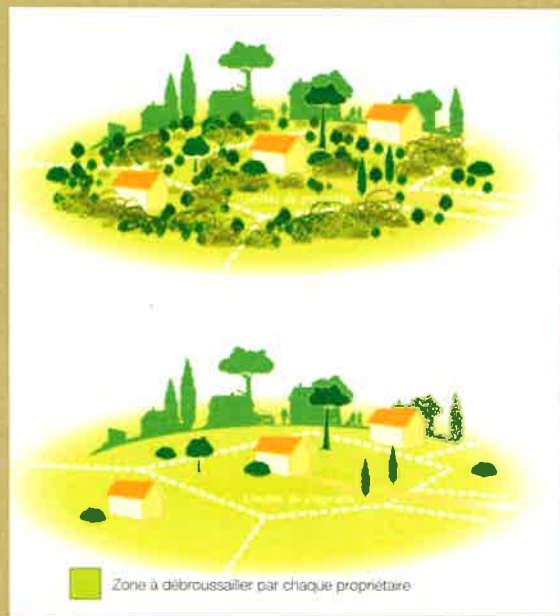
En zone urbaine